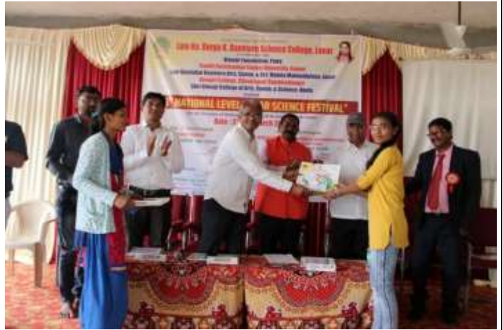
Students accepting momento and certificates for outstanding street drama