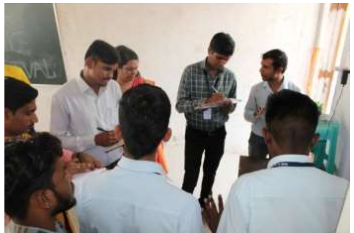
Committee member while judging science exhibition