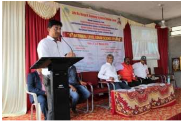
Participating faculty present for research paper