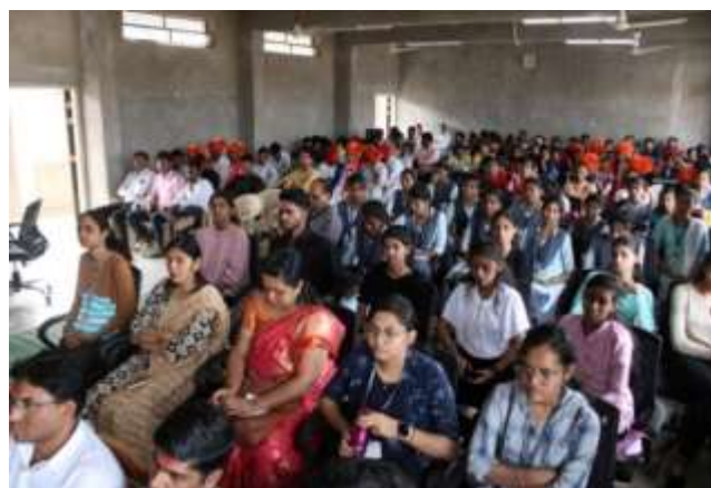
A large number of students and professors present for the science festival