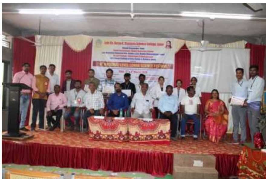
Dignitaries present on stage with award winning students