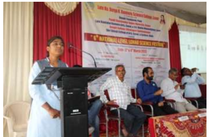
Participating students while expressing their thoughts