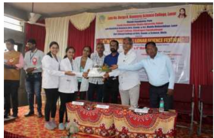
Dignitaries present on stage while distributing prizes to the winning students