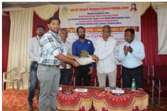
Dignitaries present on stage while distributing prizes to the winning students