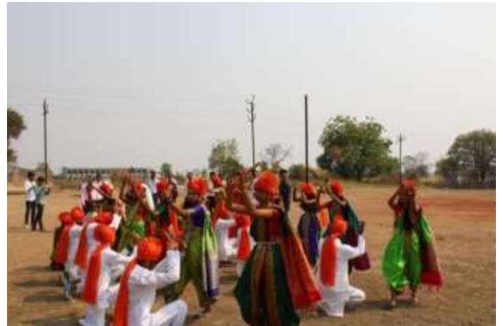
Students doing a great presentation of Lezim