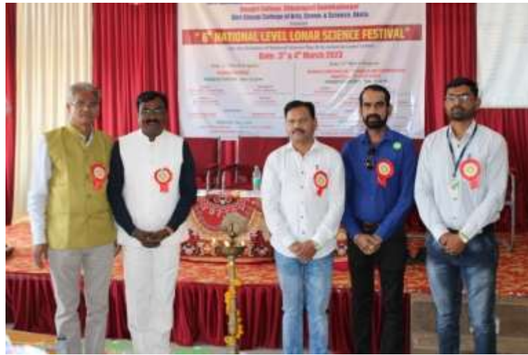
Dignitaries during the lighting of the lamp