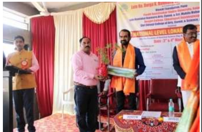
Moments from the felicitation ceremony