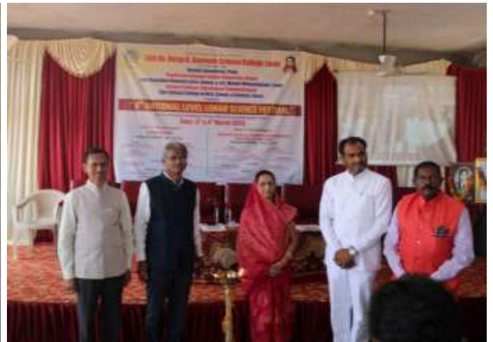
Dignitaries during lamp lighting and idol worship