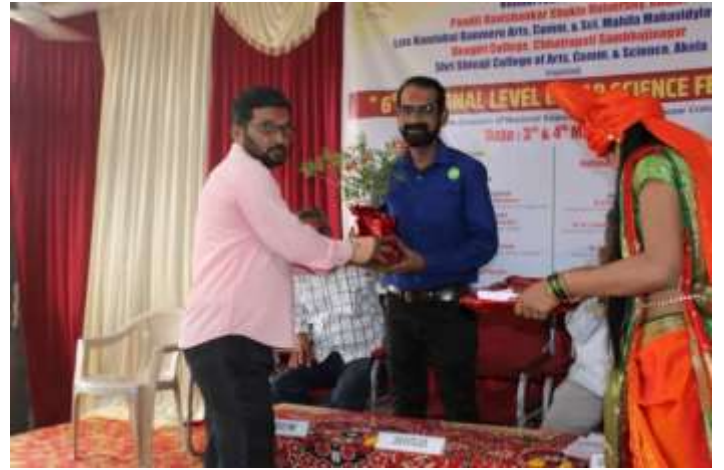
Felicitations of dignitaries in Farewell ceremony