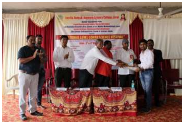
Students accepting memento and certificates for outstanding street drama