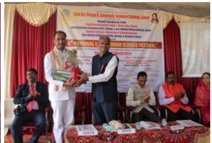
Felicitation ceremony at the inaugural function