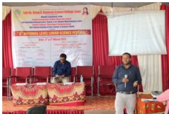
Participating faculty present for research paper