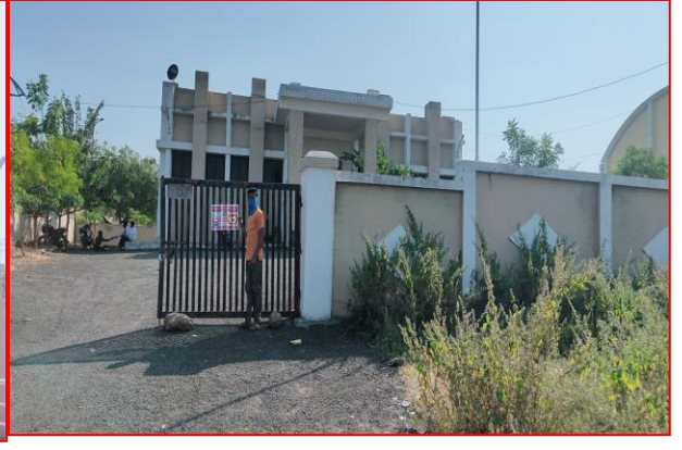
लोणार येथे ग्रामीण रुग्णालय लोणार, दुय्यम निबंधक कार्यालय येथे पोस्टर लावतांना स्वयंसेवक