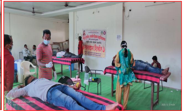
रक्तदान करतांना राष्ट्रीय सेवा योजना स्वयंसेवक