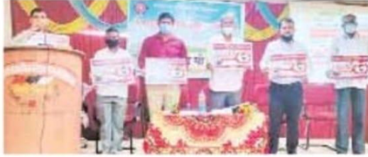
माझे कुटुंब माझी जबाबदारीचे पोस्टर प्रकाशन करतांना उपस्थित मान्यवर