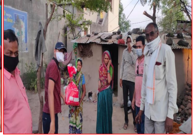
दत्तक ग्राम कुटुंबाला जीवनावश्यक साहित्य वाटप करतांना