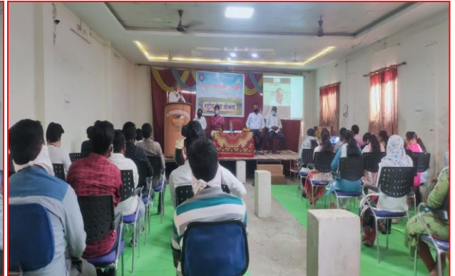
पोस्टर प्रकाशन करतांना मंचावरील मान्यवर